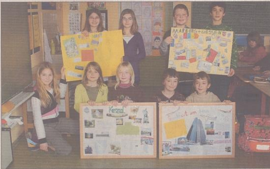
Bildliche Darstellung der Städte Hesses.