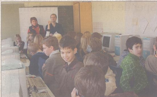
Im Computerraum ging's zur Sache.